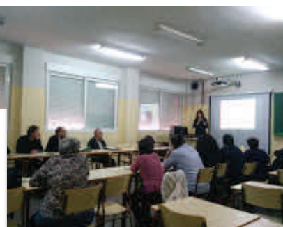
CAMINANDO HA- CIA EL ENCUEN- TRO DE JUNIO