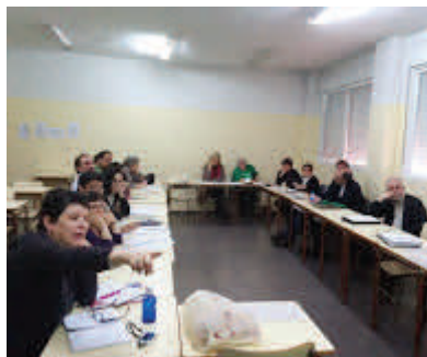
CONCLUSIONES DEL TALLER CE- LEBRADO EN ABRIL